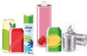
Les boîtes métalliques