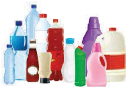
Les bouteilles et flacons en plastique

Déposés dans le sac, bac ou conteneur jaune, ils seront recyclés