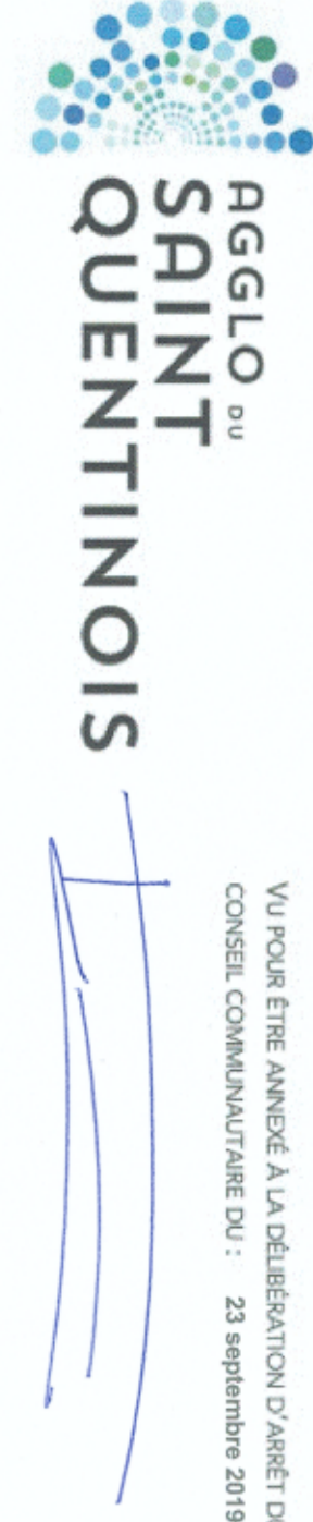
Planche : No14

Plan local d'urbanisme intercommunal - avant Programme Local de l'habitat et Plan de Développement Urbain