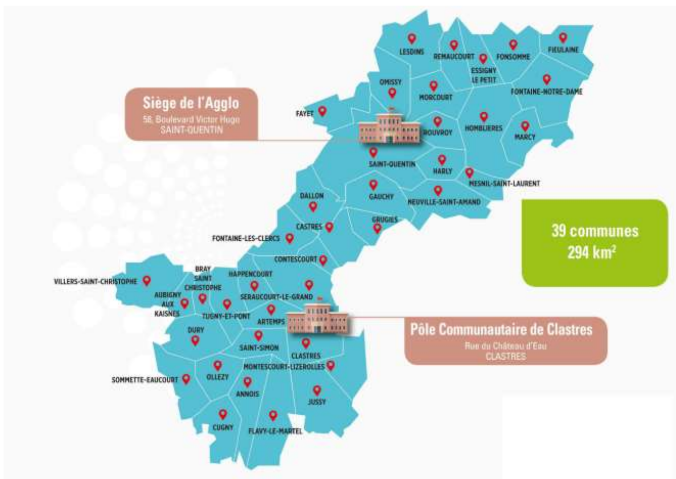
CARTE DES COMMUNES DE L'AGGLO

L'Agglomération du Saint-Quentinois, c'est 39 communes et près de 85 000 habitants, répartis sur un territoire de 294 km 2 .