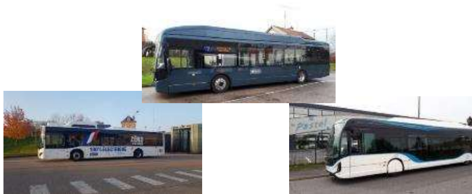
LES DIFFERENTS BUS ELECTRIQUES, DIRECTION DE L'AMENAGEMENT DU TERRITOIRE

Elle a donc entrepris plusieurs études de long terme devant permettre à la collectivité de s'engager dans l'exploitation de véhicules à faibles émissions de CO2 (hybrides, électriques, GNV, ...), équipés notamment de fonctionnalités innovantes telles que le système Efficient-Hybrid qui permet une gestion intelligente de l'énergie pour une efficacité accrue (production et stockage de l'énergie en phase de décélération et coupure du moteur à combustion à l'arrêt).