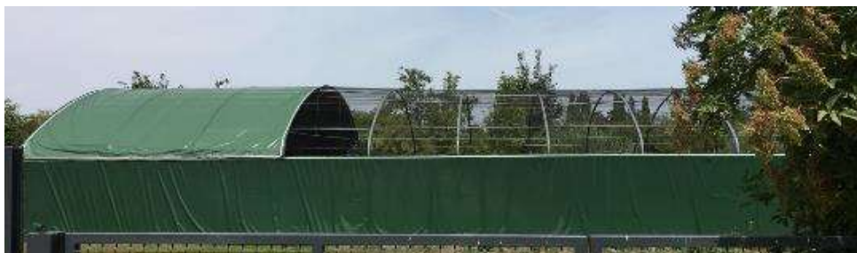
CENTRE DE SAUVEGARDE DE LA FAUNE SAUVAGE SITUE AU PARC D'ISLE A SAINT QUENTIN

Ce centre, dédié aux oiseaux sauvages victimes d'accidents ou de malveillances diverses enregistre une progression importante. En effet, au 31 juillet 2019, le Centre avait déjà accueilli 450 oiseaux victimes d'accidents ou de malveillances diverses (contre 355 en 2018).