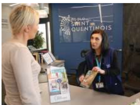
ACCUEIL DES USAGERS AU SIEGE DE L'AGGLO, 58 BOULEVARD VICTOR HUGO A SAINT-QUENTIN

Afin d'améliorer l'attractivité de notre Agglomération, de positionner l'utilisateur au cœur de son fonctionnement et de valoriser l'image d'un service public professionnel, l'Agglo du Saint-Quentinois s'est engagée dans une démarche qualité pour ses accueils.