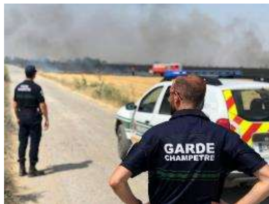
LA BRIGADE INTERCOMMUNALE DE L'ENVIRONNEMENT

Les gardes champêtres ont la triple qualité de fonctionnaires territoriaux, d'agents chargés de fonctions de police judiciaire et d'agents de la force publique. Ils exécutent les missions qui leur sont spécialement confiées par les lois et les règlements en matière de police rurale.