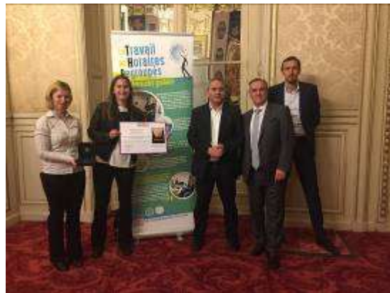
REMISE DU PRIX TERRITORIA D’OR

L’Agglo du Saint-Quentinois a d’ailleurs remporté le prix Territoria d’Or 2019 dans la catégorie qualité de vie pour ce projet.