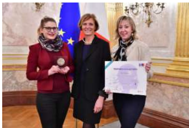
REMISE DU PRIX DE L'INNOVATION POUR LES COLLECTES ECO-RESPONSABLES CEREMONIE DES TROPHÉES ECO-ACTIONS A L'ASSEMBLEE NATIONALE - 12 MARS 2019 – PARIS.

Cette politique a d'ailleurs été récompensée en mars 2019 lors de la cérémonie des trophées Eco-Actions, par la remise du prix de l'innovation par l'association nationale des éco-maires. Les Trophées Eco-Actions consacrent les actions innovantes et exemplaires menées par les collectivités sur leur territoire en matière de développement durable et de protection de l'environnement.