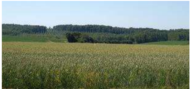
PAYSAGE AGRICOLE

Il met au point, valide et transfère une méthode d'aide à la décision pour concevoir et évaluer des stratégies d'optimisation de la gestion du carbone organique des sols dans les systèmes de culture à l'échelle d'un territoire, en intégrant sa prise en compte dans le calcul d'un bilan net des émissions de gaz à effet de serre (GES), et en s'appuyant essentiellement sur la mobilisation de données (sol, climat, cultures) disponibles sur l'ensemble du territoire français métropolitain.