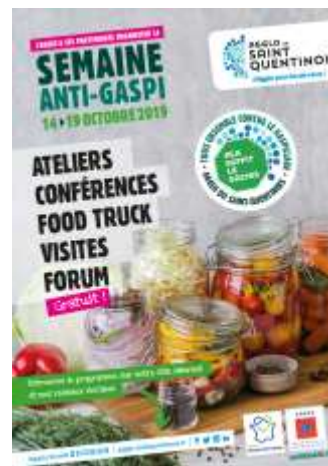
AFFICHE SEMAINE ANTI-GASPI

Du 14 au 19 octobre, l'Agglo a organisé la semaine anti-gaspi à destination de ses agents et des usagers. Au total, plus de 2 900 personnes ont été sensibilisées sur la lutte contre le gaspillage alimentaire et 242 kg de déchets évités parmi les 23 actions proposées (ateliers de cuisine, food truck, animations, ciné débat, conférences, vélo à smoothies...). Un temps fort autour d'un forum sur une journée organisée le 19 octobre aura permis de conclure la semaine et de réunir les partenaires.