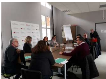
ATELIER THEMATIQUE POUR UNE NOUVELLE FEUILLE DE ROUTE REV3 POUR L'AGGLOMERATION DU SAINT-QUENTINOIS APRES-MIDI COLLABORATIVE « A LA RENCONTRE DE L'AGGLO DU SAINT QUENTINOIS, TERRITOIRE DEMONSTRATEUR REV3 » - 19 MARS 2019 – CREATIS – SAINT-QUENTIN.

Ce sont plus de 60 acteurs du territoire de tous horizons mobilisés ce jour en présence de Monsieur Philippe VASSEUR, Président de la Mission rev3, répartis en 4 ateliers autour de thématiques porteuses de sens pour un avenir rev3 : mobilité et énergie ; habitat ; emploi et formation ; économie circulaire et économie sociale et solidaire. A la suite de cet après-midi collaboratif, la création d'un « collectif rev3 » a été acté. Il regroupera tous les acteurs socio-économiques volontaires et mobilisés sur le territoire et sera animé par l'Agglo. Une première réunion a eu lieu sur la thématique de l'économie sociale et solidaire et l'économie circulaire en présence de la Région des Hauts-de-France et de la structure régionale APES (Acteurs Pour une Economie Solidaire). Suite à cette réunion, des pistes d'actions ont été évoqués, notamment des réunions de travail avec les acteurs locaux concernés.