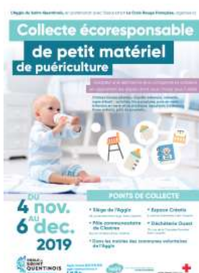
AFFICHE COLLECTE DE PETIT MATERIEL DE PUERICULTURE

Depuis décembre 2016, l'Agglo du Saint-Quentinois met en place des collectes éco-responsables à destination des habitants du territoire. Les partenariats se font de préférence avec des associations locales. L'Agglo du Saint-Quentinois propose ces collectes afin de sensibiliser les agents de la collectivité et les citoyens aux gestes éco-responsables, d'aider les associations et les usagers grâce à cette démarche éco-solaire et enfin, de donner une seconde vie aux objets qui n'ont plus d'utilité et ainsi permettre la réduction des déchets via un circuit d'économie circulaire.