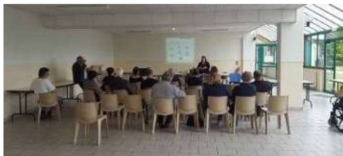
SENSIBILISATION DES HABITANTS AU TRI DES DECHETS

En octobre 2019, un composteur a été installé au siège de l'Agglomération du Saint-Quentinois pour que les agents puissent y déposer leurs déchets de cuisine.