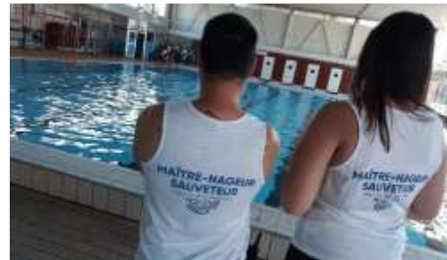
LES MAITRES-NAGEURS SAUVETEURS DE L'AGGLO

Pour l'année 2019, dans le cadre des nouvelles orientations du Ministère des sports, un accent plus particulier est mis sur l'apprentissage de l'aisance aquatique à destination des plus jeunes. Le dispositif est donc élargi aux enfants de 4 et 5 ans. L'action, mise en place à la piscine de Gauchy, permettra de former à la natation 36 enfants.