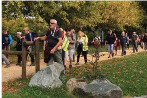
RANDONNEE PEDESTRE SUR LES SENTIERS DE L'AGGLO DU SAINT-QUENTINOIS

Sur le territoire de la nouvelle Agglo, plus de 170 kilomètres de chemins, de promenades à pied, en VTT et en canoë permettent la découverte des paysages du Saint-Quentinois caractérisés par de vastes étendues de plaines ondulées. Ce sont 16 sentiers terrestres qui sillonnent les plaines, les villages ruraux et les vallées. Deux sentiers nautiques permettent une immersion sur le cours du fleuve Somme à l'aval de Seraucourt-le-Grand et deux sentiers botaniques animent les étangs de Saint-Simon et de Seraucourt-le-Grand.