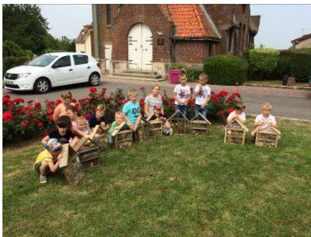
LES ATELIERS ITINERANTS DE L'AGGLO

Des recettes ou tutoriels ont également été remis aux usagers et sont disponibles sur le site internet de la collectivité.