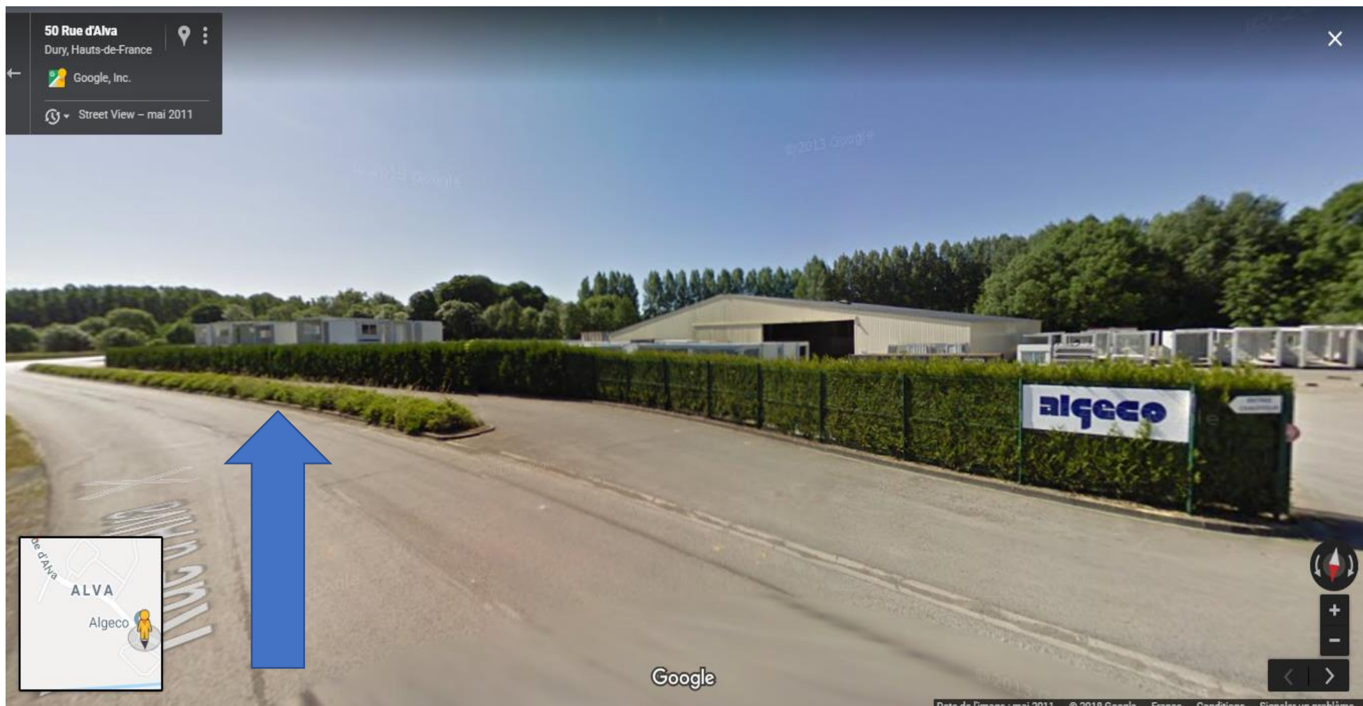
Parcelle cadastrée section ZL n°110 d'une surface de 251 m 2 située rue d'Alva à DURY