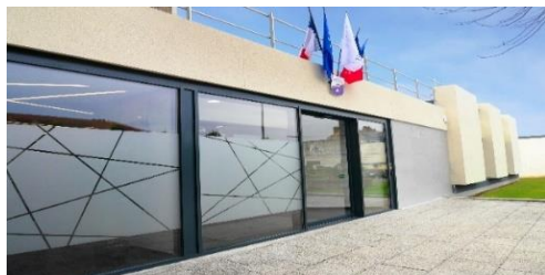
Agglomération du Saint-Quentinois 58 boulevard Victor Hugo – BP 80352 – 02108 SAINT-QUENTIN CEDEX Lundi au vendredi de 8h30 à 18h30